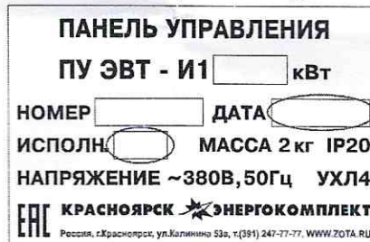
Рис.2. Шильдик панели управления ПУ ЭВТ И1